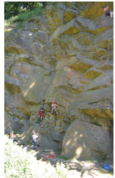
In NRW geht es mit dem Klettersport langsam bergauf – hier im Steinbruch Isenberg bei Bochum

Weil aber Mountain Wilderness nicht nur die Intaktheit der Natur schützen will, sondern auch das Erlebnis wilder Natur, ist es uns nicht egal, wie der Natursport ausgeübt wird: So gehört in die Wildnisbereiche der Felsen eigentlich nur »clean climbing«! Zumindest ist der sparsamste Umgang mit fest installierten Sicherungsmitteln angemessen. Klettern mit mobilen Sicherungsmitteln, wo immer möglich, ist Trumpf. Und es verlangt eben