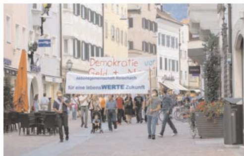
Aufgebot: Am 1. August demonstrierten rund 20 Vereine in der Brunecker Innenstadt

Auf der gut besuchten Kundgebung Anfang August wurde eine weitere Unstimmigkeit angesprochen: Mit einer neu zu schaffenden Zugsanbindung soll das Projekt umweltfreundlich wirken. Dabei wird aber außer Acht gelassen, dass es in Bruneck die Möglichkeit gäbe, die heutige Talstation Reischach mit dem neu geplanten Mobilitätszentrum zu verbinden. Diesbezügliche Pläne wurden vom Gemeinderat mit der Begründung abgelehnt, es gebe keinen Geldgeber für deren Realisierung, denn die Kronplatz Seilbahn AG finanziert lediglich ihr Projekt Ried. —mp—