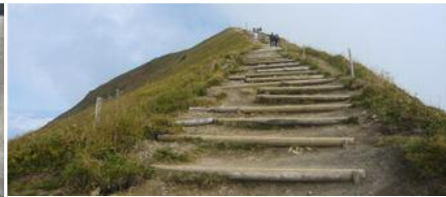
Publikumsmagnet oder nötige Baumaßnahme? Der Übergang am Meraner Höhenweg bei Naturns